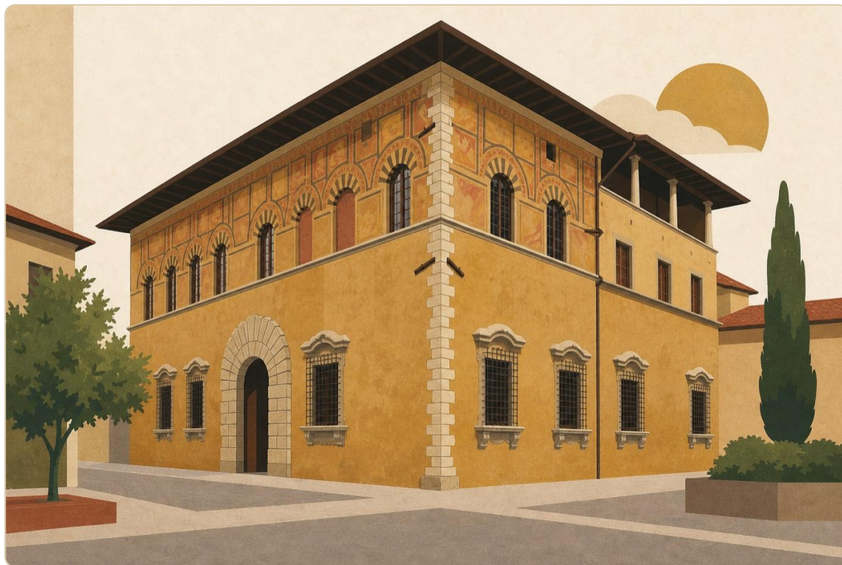
Palazzo Datini, residenza di Francesco di Marco Datini (1383). Oggi Archivio di Stato e Fondazione Datini

Tra il 1351 e il 1410 — i cinquant'anni della cessione fiorentina e dei primi decenni di subordinazione — Prato conosce paradossalmente la sua fase di maggiore proiezione internazionale . Lo deve a un singolo individuo: Francesco di Marco Datini.