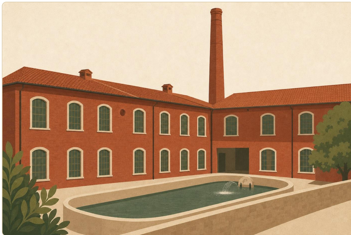
Ex-Cimateria Campolmi, oggi Museo del Tessuto di Prato — il distretto laniero che si fa memoria di sé

Quasi mezzo secolo di “miracolo pratese” — dalla Ricostruzione fino al voltare degli anni Novanta, quando l’arrivo dell’immigrazione cinese e la prima crisi del modello aprono una fase nuova. Sono i decenni in cui Prato diventa il caso paradigmatico del “distretto industriale italiano”, studiato a livello internazionale come modello alternativo alla grande impresa fordista.