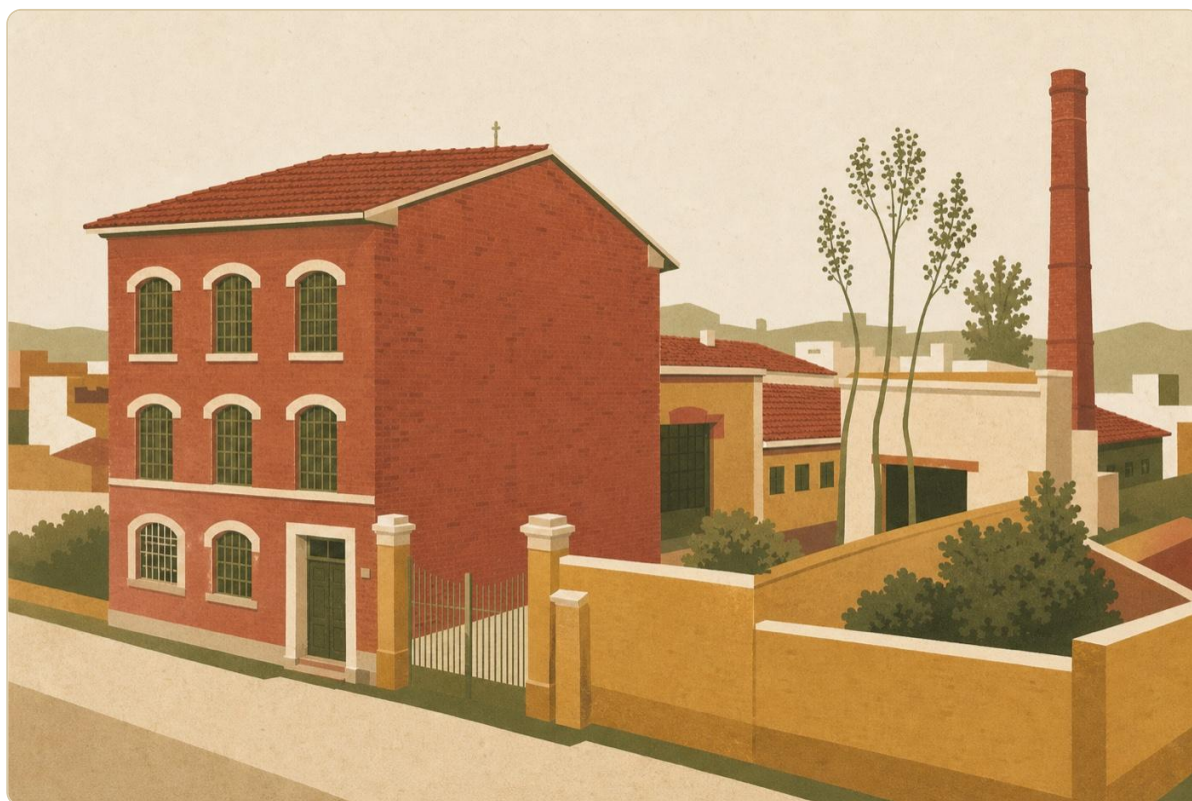
Il Lanificio Calamai – uno dei grandi opifici tessili pratesi dell'Ottocento

Quarant'anni che fondano il “modello Prato” moderno: piccola impresa diffusa, integrazione produttiva, specializzazione nella lana rigenerata, banche locali, scuole professionali. La gerarchia tessile italiana si ridisegna. Schio (Veneto, dominata dalla famiglia Rossi) ha capitale aristocratico e fabbrica integrata. Biella (Piemonte) ha fortuna piemontese e qualità alta. Prato ha tutto contro — mancano capitale, credito, ferrovia adeguata, istruzione tecnica — e tuttavia cresce, perché diversifica all'estremo e capitalizza ogni profitto generato.