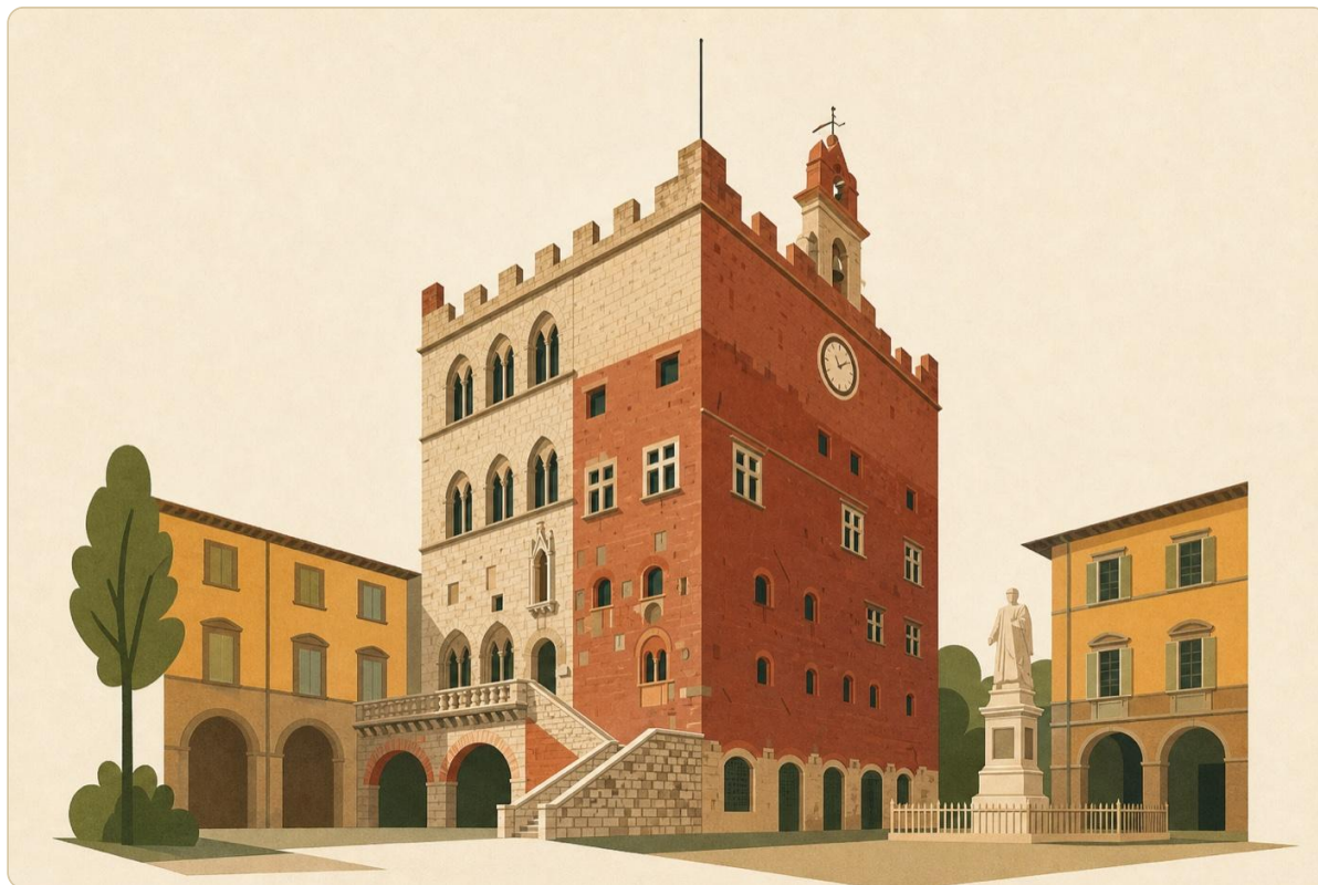
Palazzo Pretorio in Piazza del Comune — sede storica del Comune di Prato, oggi Museo Civico

Nel 1737 muore Gian Gastone, ultimo granduca della dinastia Medici. La Toscana, per trattato internazionale, passa agli Asburgo-Lorena . È un cambio di dinastia che ha conseguenze immediate per Prato: si apre il “secondo Risorgimento” del lanificio pratese, prima ancora del Risorgimento politico-nazionale.