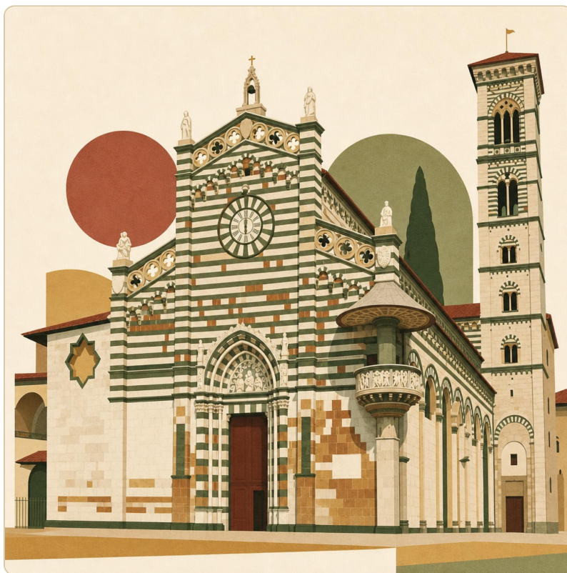
La Cattedrale di Santo Stefano — già pieve attestata dal VI secolo, cuore religioso del Borgo al Cornio

Nota onesta sulle fonti. Questo è il capitolo per cui le fonti sono strutturalmente più povere . Cinque secoli di storia (V-X sec) sono coperti da pochissimi documenti scritti — qualche diploma imperiale, le carte del capitolo pistoiese, qualche menzione in cronache lontane — e dall’archeologia, che a Prato per la fase altomedievale ha lasciato poche tracce indagate. Anche nel draft espanso questo capitolo resta il meno denso del libro: 5 secoli si raccontano in qualche pagina, non in trenta. È un limite reale della storiografia, non della pigrizia del compilatore.