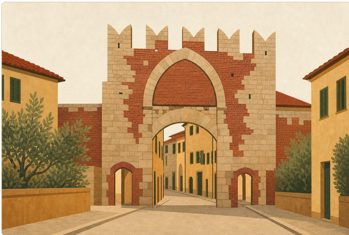
Porta Pistoiese, una delle otto porte della prima cerchia muraria comunale (1175-1196)

Per più di due secoli — dal 1140 circa al 1351 — Prato è una repubblica libera. Lo è prima de iure (con istituzioni proprie), poi sempre più de facto erosa dall'infiltrazione fiorentina, infine venduta a Firenze il 23 febbraio 1351 per 17.500 fiorini d'oro. Questi due secoli e mezzo costituiscono il primo periodo aureo della città : vi si formano le strutture politiche, urbanistiche ed economiche che durano — molte di esse — fino a oggi. Le mura che si vedono ancora oggi camminando dal Mercatale a Porta al Serraglio sono di questo periodo; gli otto rioni storici della città sono di questo periodo; l'Arte della Lana che ridiventerà famosa nell'Ottocento ( cap. 6 ) e nel Novecento ( cap. 8 ) si codifica in questo periodo.